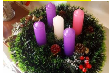
IMAGEN DE REFERENCIA CORONA DE ADVIENTO.

08:00 A 08:15 hrs. Traer libro de Lectura Complementaria para realizar estrategias de Lectura con docente. Se registrará en el libro de clases que los estudiantes hayan cumplido con su libro mensual. ES OBLIGATORIO.