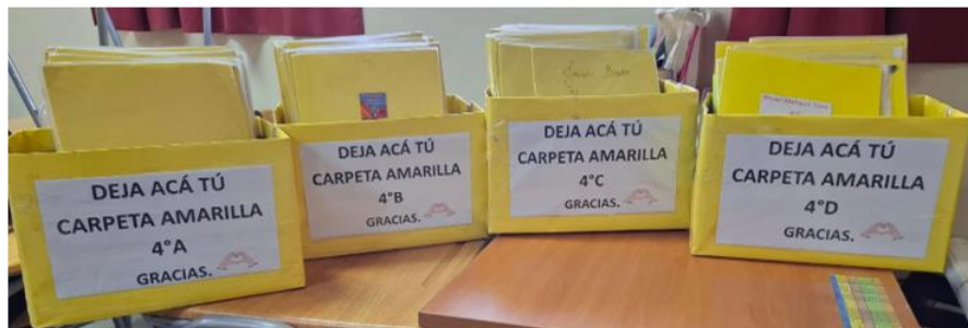
FECHAS DE MONITOREO DE LECTURA 2º SEMESTRE. CARPETA AMARILLA

Solicito recordar a los y las estudiantes que deben dejar las carpetas amarillas en las cajas que se encuentran en cada sala con su respectivo curso, además recordar que deben ser entregadas los días martes de cada semana tal como se señala en el calendario de las fechas de monitoreo, adjuntada más abajo y en las carpetas, estas serán retiradas al término de la jornada del día martes. También solicito recordar que los alumnos deben registrar la lectura y los apoderados deben firmar la lectura.