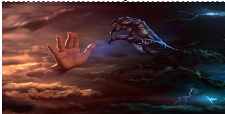
El bien y el mal