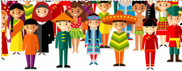
Cultura o pueblo