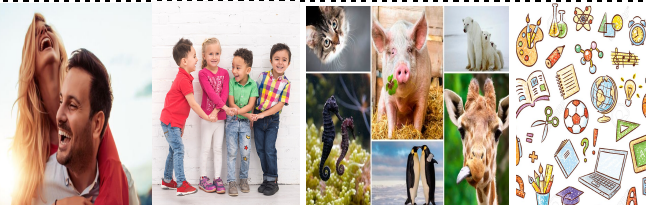
Hombres, mujeres, niños, animales y cosas