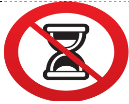
Sin tiempo definido