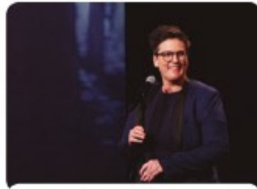
▲ El stand-up comedy. Una exponente es la australiana Hannah Gadsby.