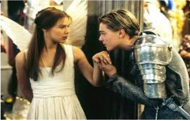
ROMEO Y JULIETA. Tragedia de William Shakespeare