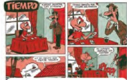
▲ Las tiras cómicas o historietas, como Condorito.