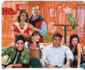
▲ Las sitcom o comedias de situaciones, como Casado con hijos .

Además, diversas producciones culturales actuales expresan una mirada crítica de la sociedad, apoyándose en los mismos principios de la comedia. Por ejemplo: