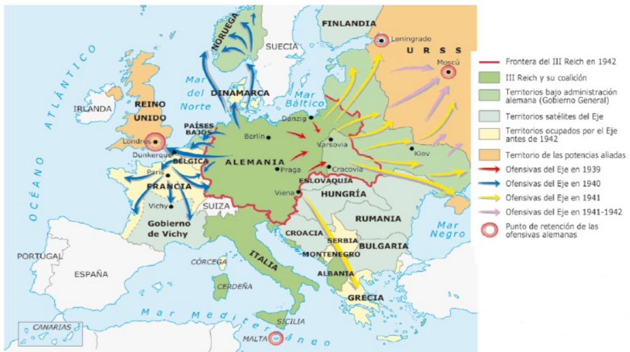
Las ofensivas alemanas, 1939 - 1942