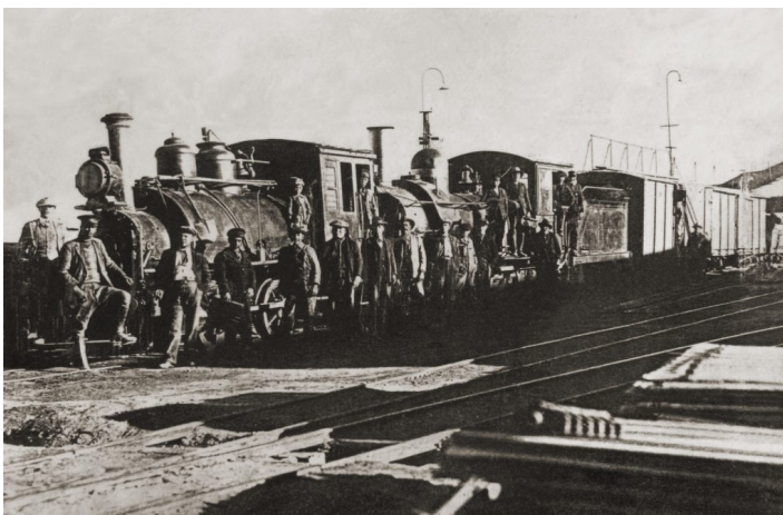
Ferrocarril arica la paz

Como consecuencia de los crecientes ingresos tributarios, el gobierno chileno adquirió una mayor participación en la economía. La alta inversión fiscal entre los años 1891 y 1920 estuvo destinada fundamentalmente a la construcción de ferrocarriles y otras obras públicas, especialmente puertos. En 1899, la red ferroviaria estatal tenía un total de 1.986 kilómetros; en 1920 esta cifra había aumentado a 4.579, y Chile quedaba unido entre Iquique y Puerto Montt. También se construyeron los ferrocarriles internacionales de Arica a La Paz y de Los Andes a Mendoza.