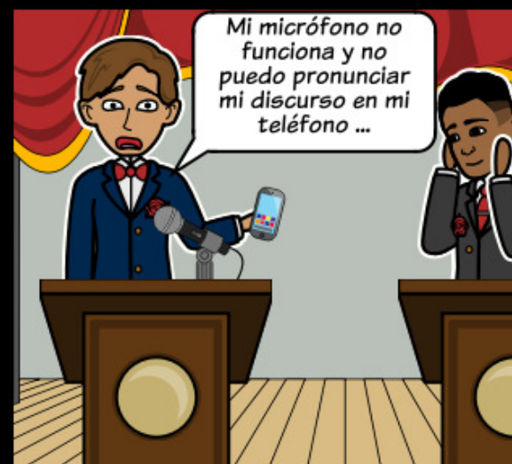
Cuando un individuo o grupo enfrenta resistencia para lograr un objetivo con la tecnología.