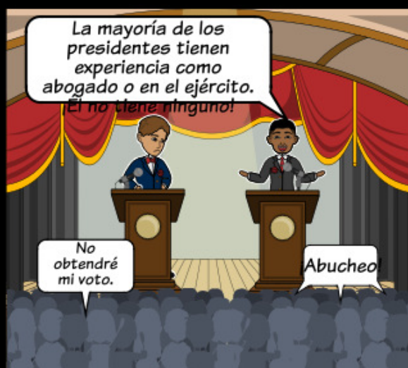
Cuando un individuo o grupo va en contra de las normas culturales o creencias.