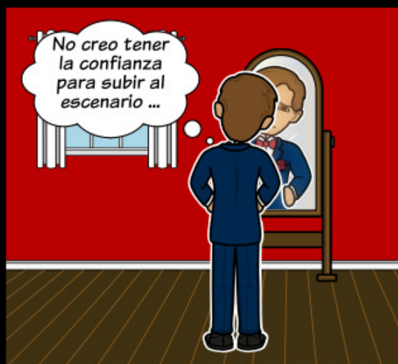
Cuando un individuo enfrenta una lucha interna.