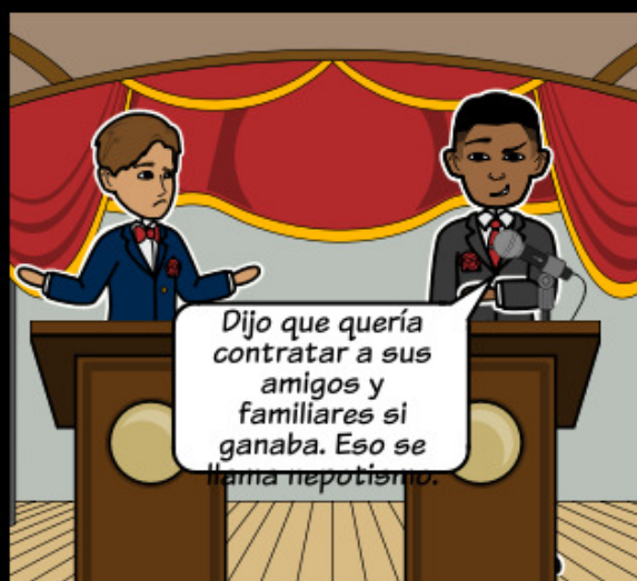
Cuando los resultados deseados de una persona o grupo interrumpen el resultado deseado general.