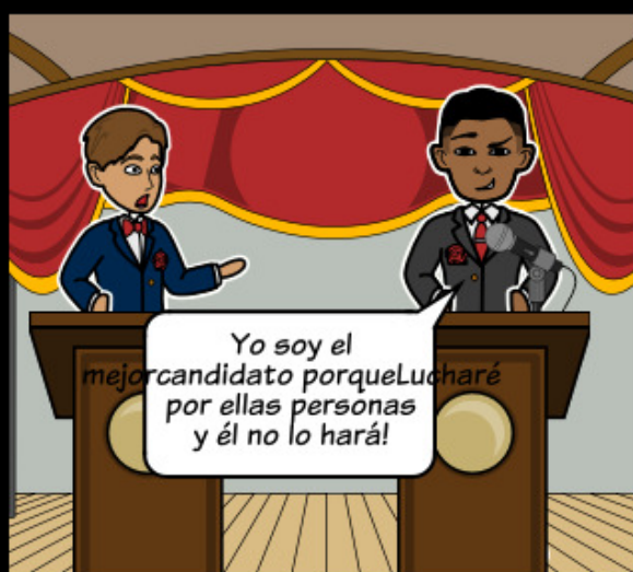
Cuando un individuo o grupo enfrenta oposición de otra persona o grupo.