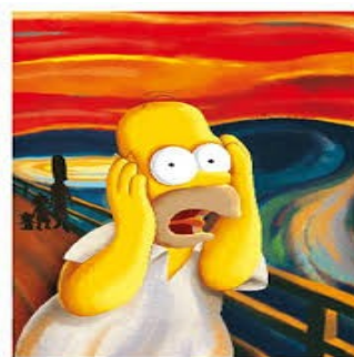
El grito, Los Simpsons.