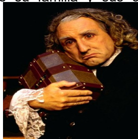
El Avaro, de Molière.