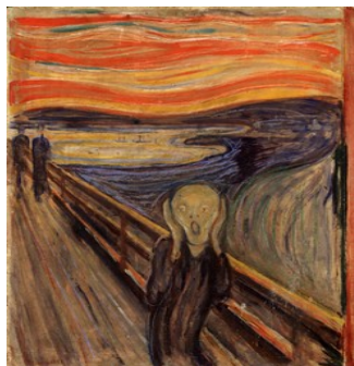
El grito, Edvard Munch.