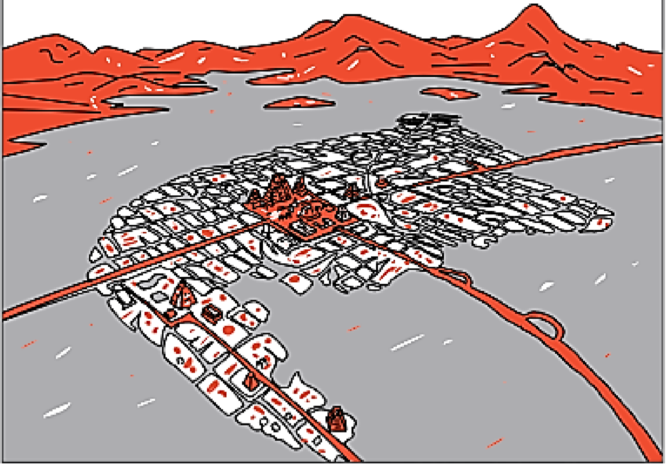
Ciudad de Tenochtitlán en el lago Texcoco.