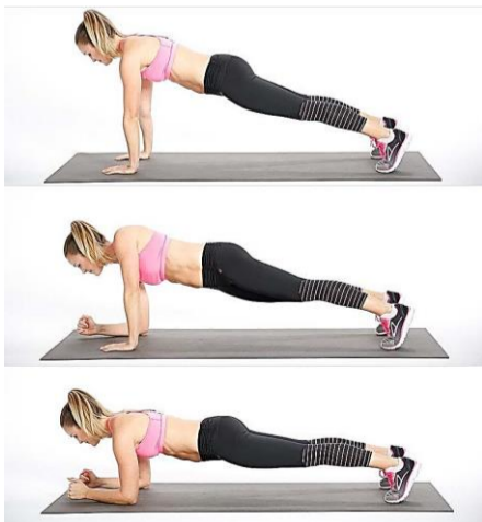
Plancha (Observa bien la postura, debes tener la espalda recta.)