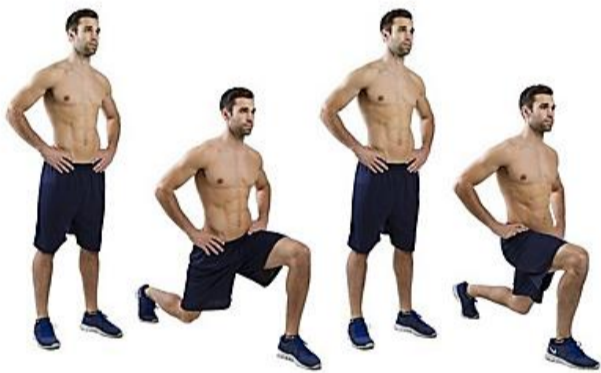
Estocada (Para realizar debe tener la espalda recta, la rodilla no debe sobrepasar la punta del pie)