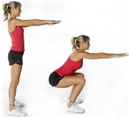
Sentadillas (Al realizar el ejercicios debes tener la espalda recta.)