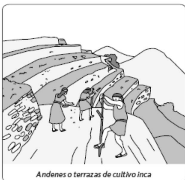
Andenes o terrazas de cultivo inca