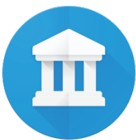
Google Arts & Culture