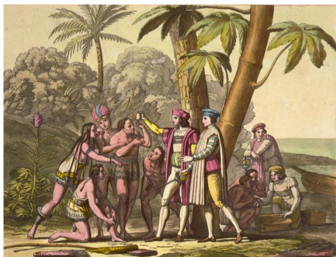
Litografía coloreada a mano, aprox. 1860-1880. http://commons.wikimedia.org/wiki/File:Christopher_Columbus_mbus6.jpg

El 11 de octubre el viento fue fuerte y la velocidad grande. Los indicios de tierra se multiplicaban: una rama verde, una tabla, un pequeño bastón labrado. Los hombres no estaban lejos. Por la noche hubo luna pura y clara, que lo iluminaba todo delante de los barcos. El miedo a las rocas tensaba los nervios.