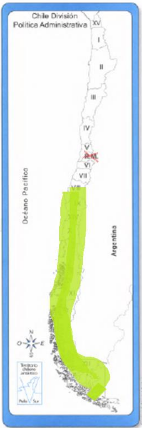
Equipo Editorial Aconcagua