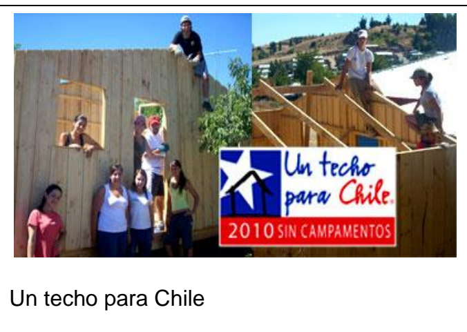
Un techo para Chile