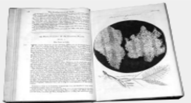
▲ Hooke en realidad observó los restos de las paredes de células muertas del corcho.

Pese a que Hooke acuñó el término célula en el campo de la biología en 1655, pasaron muchos años antes de que tuviera el significado de unidad estructural y funcional de los seres vivos. El cambio se logró gracias a los aportes de las investigaciones de otros científicos.