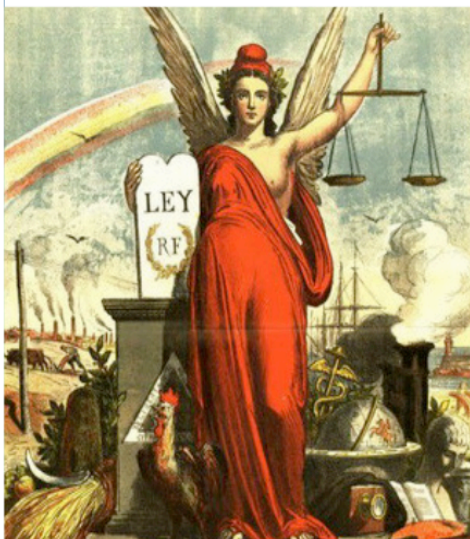
Padró y Pedret, T. (1873). Alegoría de la proclamación de la Primera República de España. (s. i.) (Detalle).

Esta imagen representa la Primera República de España (1873-1874), primer intento de gobierno republicano en este país.