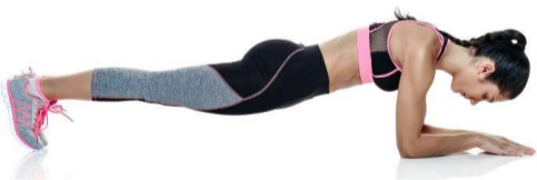
Plancha (observa bien postura, debes tener la espalda recta)