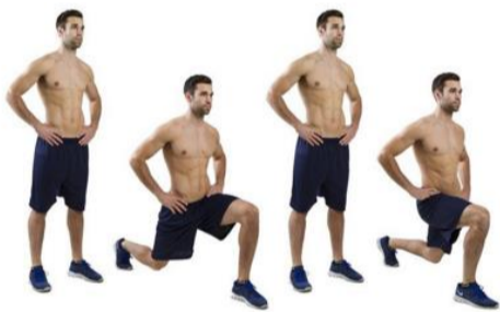
Estocada (para realizar debe tener la espalda recta, la rodilla no debe sobrepasar la punta del pie)