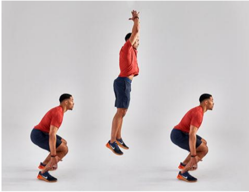
Sentadilla con salto