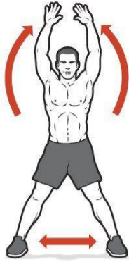
Salto de tijera