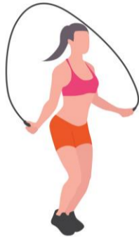
Salto de cuerda