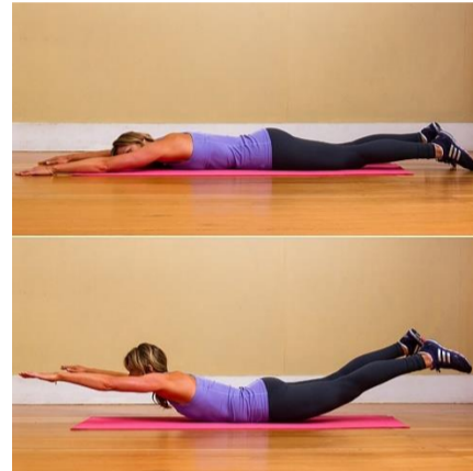
Espinales brazo extendidos