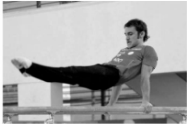
Tomás González Sepúlveda, gimnasta chileno.